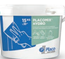
Enduit prêt à l'emploi (15 kg)