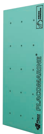
Plaques de plâtre, cloisons ou complexes isolants hydrofugés*

Les SOLUTIONS PLACO® pour les LOCAUX HUMIDES PRIVATIFS (EB+p)