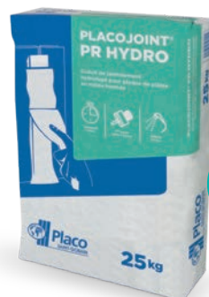
Enduit en poudre (10 kg ou 25 kg)